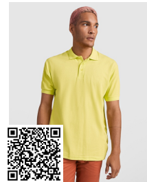
PEGASO PREMIUM PO6609