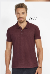
PHOENIX MEN 01708