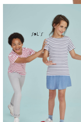
MILES KIDS 01400